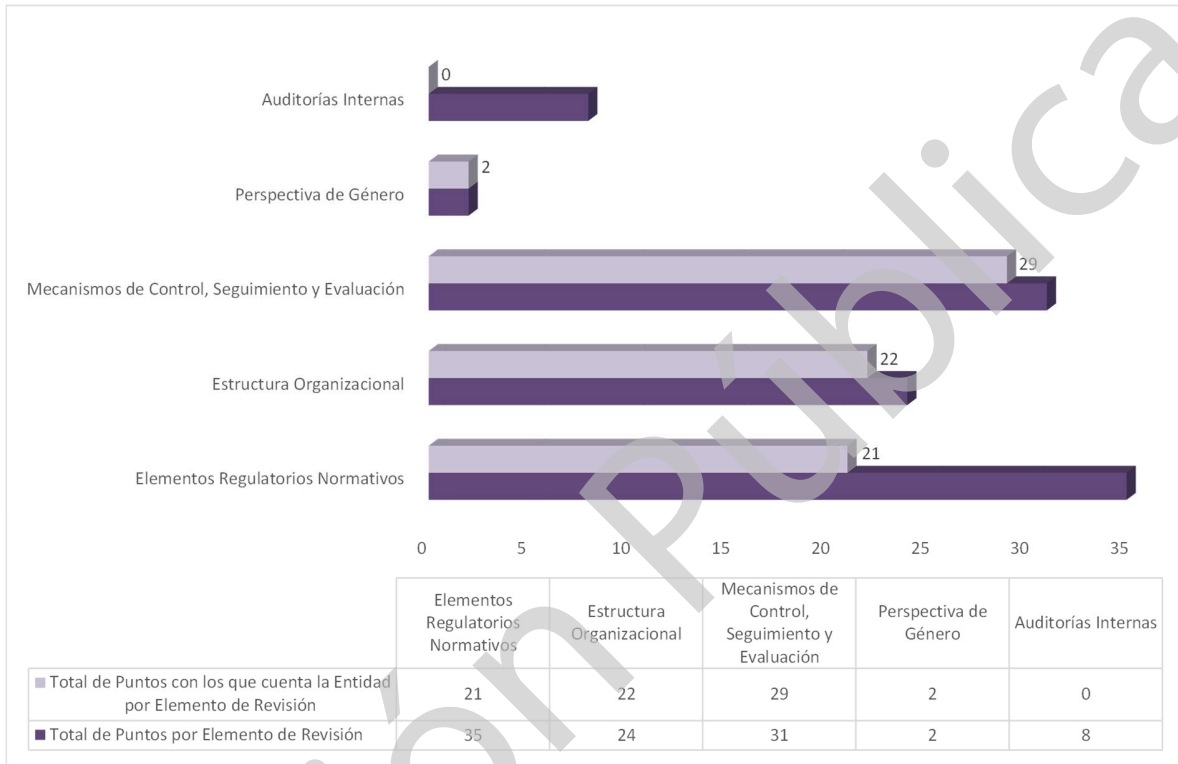
Grafica 1 Cumplimiento de los Mecanismos de Control Interno Ejercicio 2020